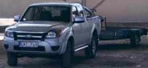
Skurup Sparbank Arena